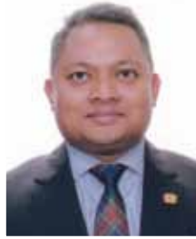
YBhg. Dato Yubazlan Yusof Consul General

على مدى العقود القليلة الماضية، تطورت ماليزيا بصورة مذهلة من دولة تعتمد بالدرجة الأولى على الزراعة والسلع الأساسية إلى اقتصاد صناعي يعتمد على التصدير.